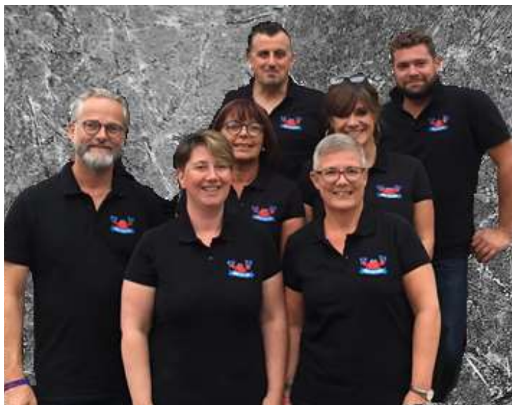
Le C.A. de l'asbl CRAC'SATHON